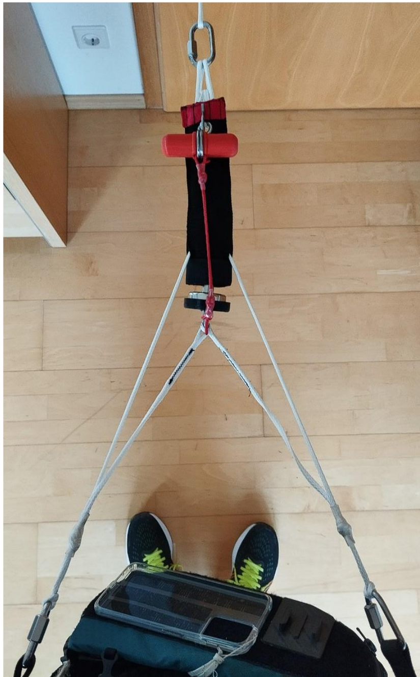
Abbildung: Klinke am Gurtzeug montiert und mit freilaufenden Leinen und korrekt am Schleppseil, bzw. Schraubglied eingehängt.