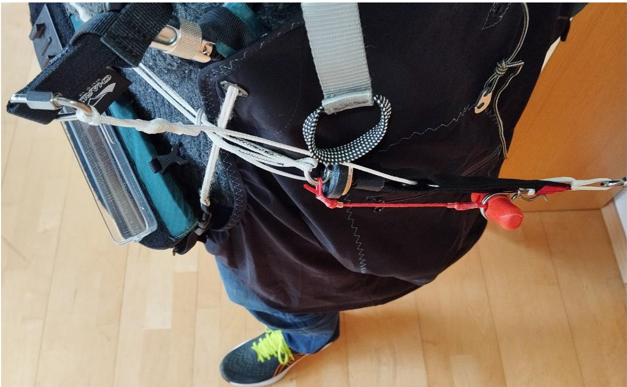
Abbildung: Das Schleppseil geht beim Wegfliegen von der Winde auf Hüfthöhe am Piloten vorbei.

Beim Zurückfliegen zur Winde ist darauf zu achten, dass das Schleppseil seitlich auf Hüfthöhe am Piloten vorbeiläuft und der rote Auslösegriff nicht zwischen Gurtzeug und Klinke eingeklemmt wird!