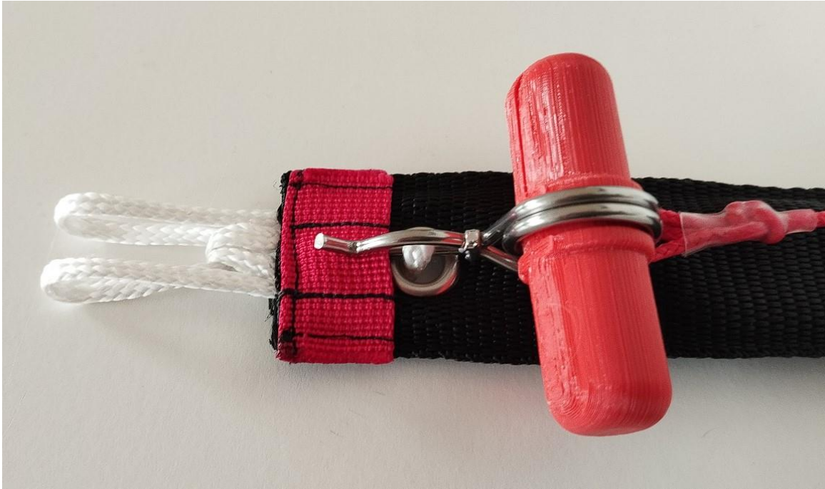
Abbildung: Den unteren Stift der Klammer durch die weiße Schlaufe schieben und unter das rote Querband bis zur Quernaht durchschieben. Die obere gebogene Klammer liegt wie abgebildet auf dem roten Querband.