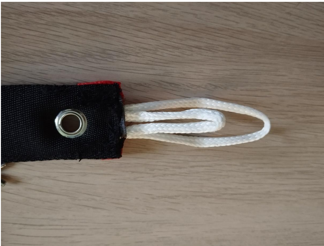
Abbildung: Vorderer Teil der Klinke von unten abgebildet.

Folgend wird der Ablauf zum Einhängen des Vorseils beschrieben.