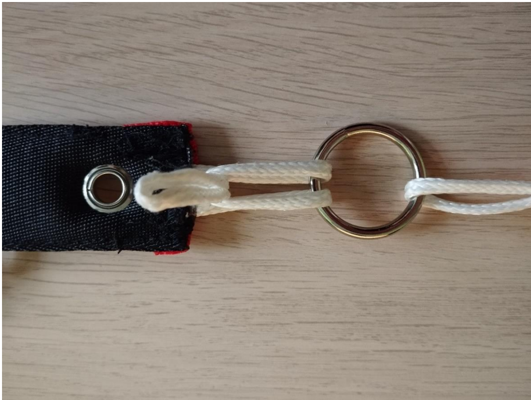
Abbildung: Die Kurzleine wird durch die Langleine gefädelt und von unten durch die Öse nach oben geführt.