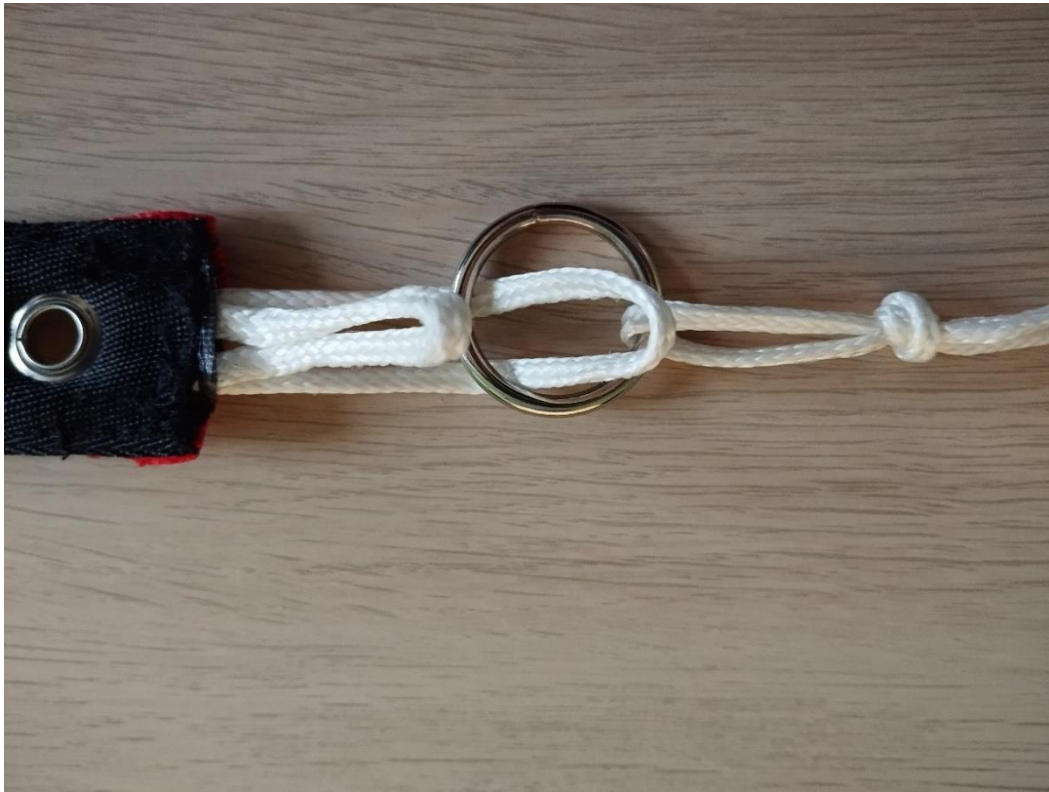
Abbildung: Die lange Schlaufe der Klinke wird durch den Ring des Vorseils geführt.